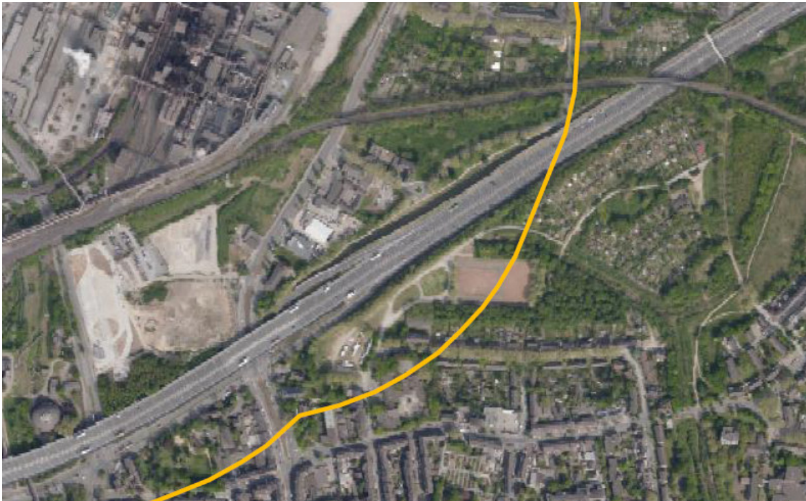
Kartenausschnitt der Umhüllenden, die auf Grundlage der AEGL-2-Werte für CO ermittelt wurde (Bez.Reg. Düsseldorf)

Gemäß den vorliegenden Informationen zur Ermittlung der angemessenen Sicherheitsabstände auf Grundlage der AEGL-2-Werte für CO, befindet sich der Geltungsbereich des Bebauungsplanes Nr. 1106 -Beeck- „Grüngürtel Duisburg Nord“ innerhalb dieses Abstandes zu den Störfallquellbereichen auf der Werksanlage von ThyssenKrupp Steel (TKS).